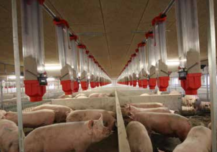
Søer i storsti med tørfoder