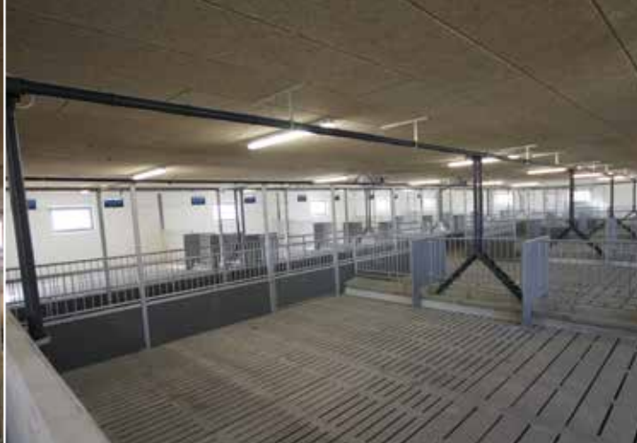
Søer i storsti med vådfoder