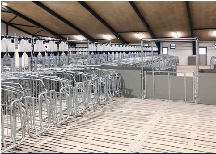
Wartestall mit L-Bucht und Fress- und Liegeboxen