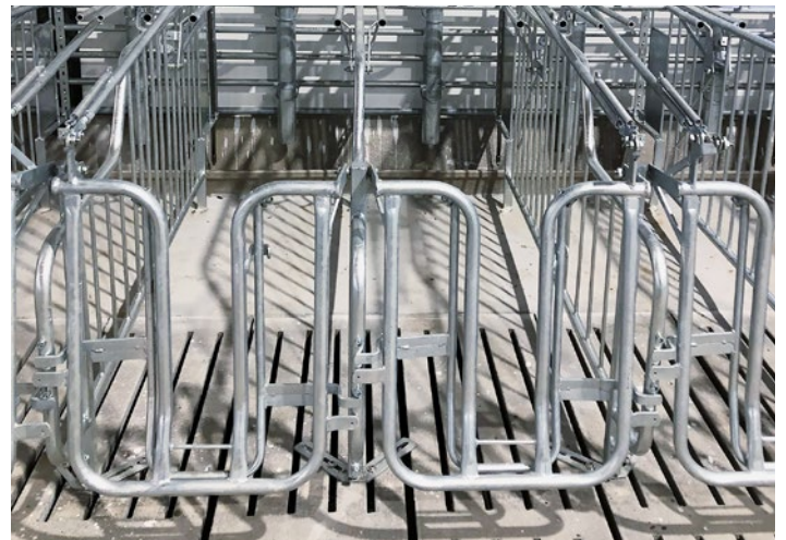
Rücktür mit leichtem Zugang für das Personal