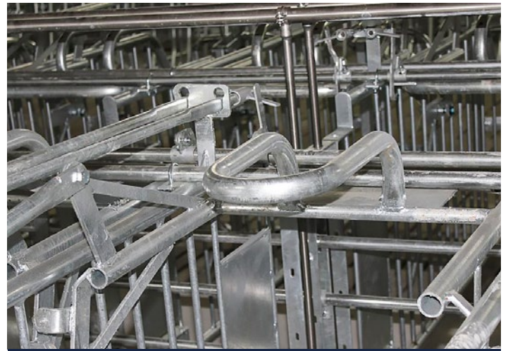
Einfacher Zugriff auf die Sau