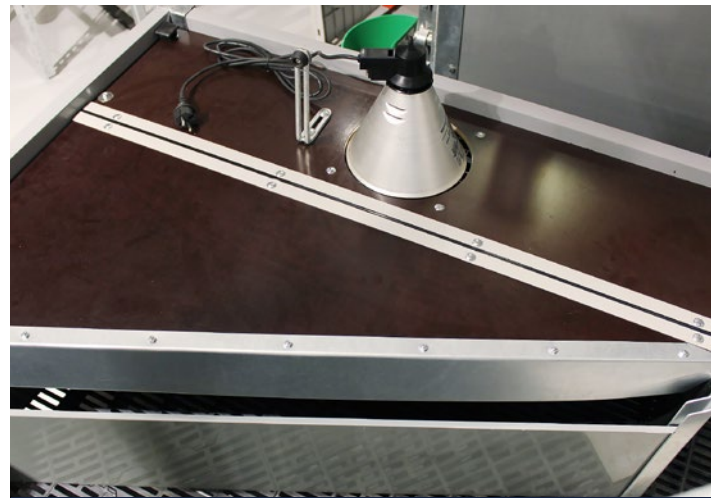
Zweigeteiltes Ferkelnest mit Trennplatte und Wärmelampe