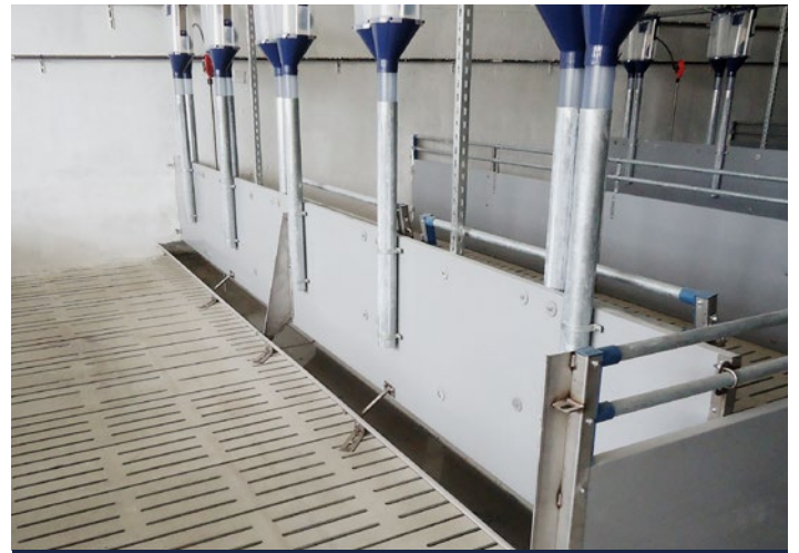
Trog aus rostfreiem Stahl