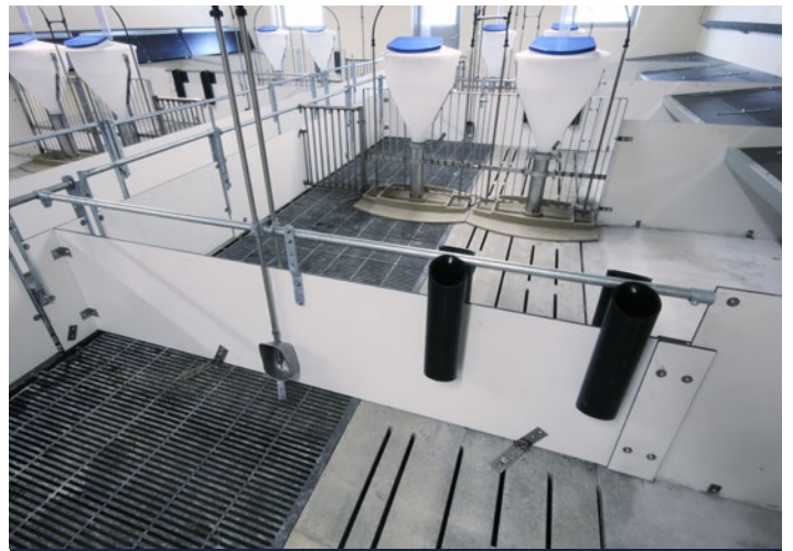
Stiside og samlinger