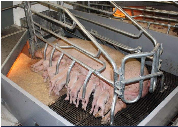
Teleskop-bagblåge og vipbar gavlfælle