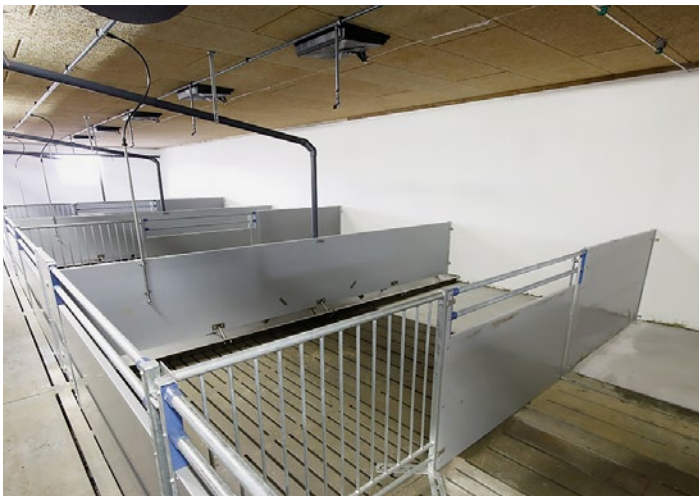
Slagtesvinesti med vådfodring