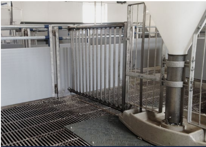
Lille låge, rustfrit gitter og foderautomat