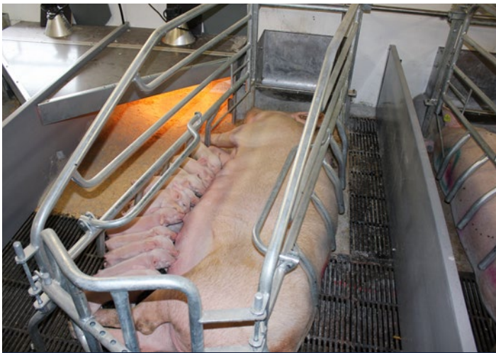
Kastenstand mit kippbaren Bügeln