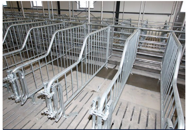
Kastenstand mit Saloontüren