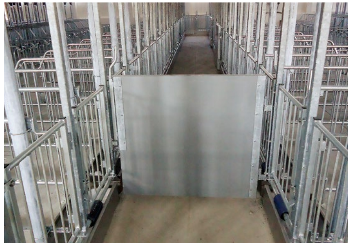
Ворота для хряка