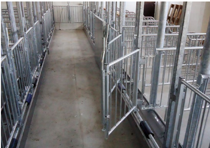
Станок для осеменения с передним выходом